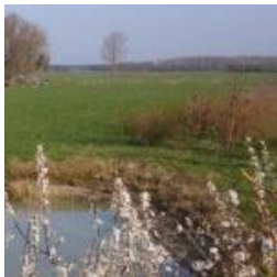
Agenda voor het komend half jaar