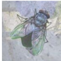
Rubriek Japanse poëzie