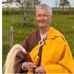
Anshin Tenjo roshi