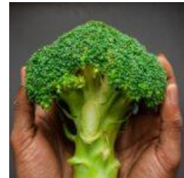
Hulpskok in sesshin