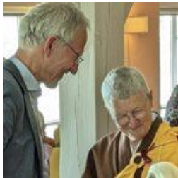
Foto's zenmeester ordinatie