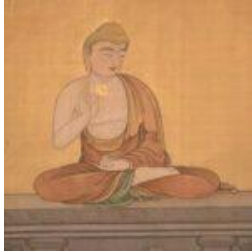
Jiun roshi over Dharmatransmissie