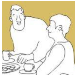
Cartoon van ArdAn