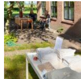
Vrienden van de Noorder Poort