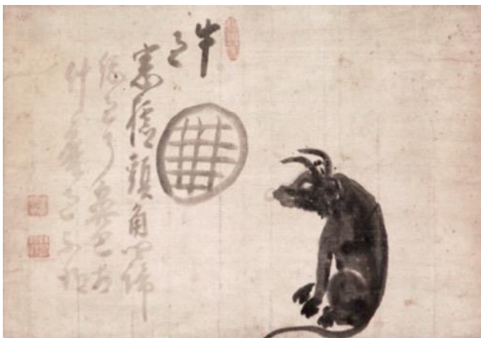
Haikuin's beeld bij de koan van de Buffel die aan het raam voorbijgaat

In een tijd waarin ik erg ongerust was over de toekomst van mijn autistische zoon, zag ik opeens helder dat ook als dingen verkeerd gaan, er altijd dat aspect van de werkelijkheid is waar verkeerd en goed geen betekenis hebben. Op dat moment wist ik dat zijn leven niet kan mislukken, omdat zoiets als een mislukt leven niet bestaat.