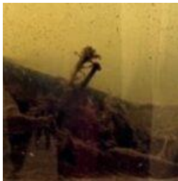
Dichter bij Zen