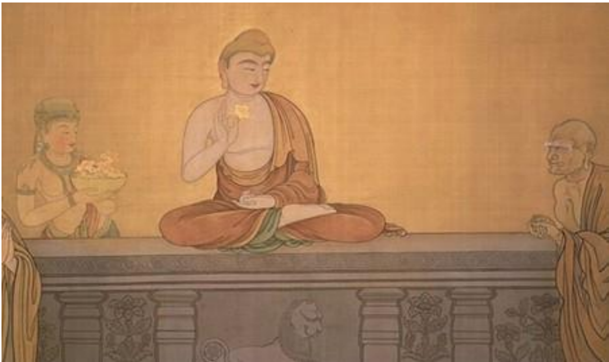
Mahakasyapa smiling at the lotus flower, by Hishida Shunso, 1897, Nihonga style