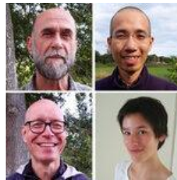
Plaats voor nieuwe bewoners