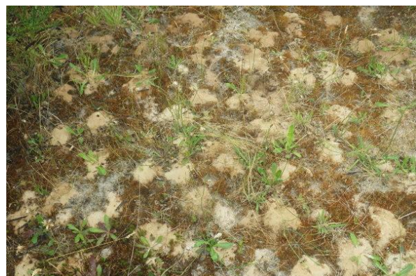
De kolonie bij de brempoel