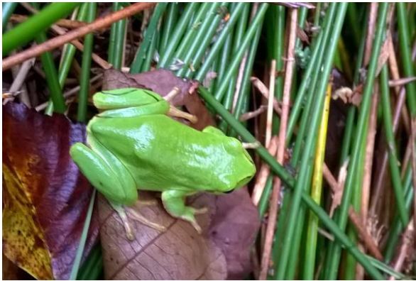
Boomkikker in de dobbe

Ook van Ajit is het fraaie zoekplaatje hieronder: welk dier (ook niet eerder aangetroffen op het terrein) staat op deze foto?