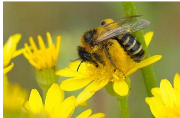
... en één